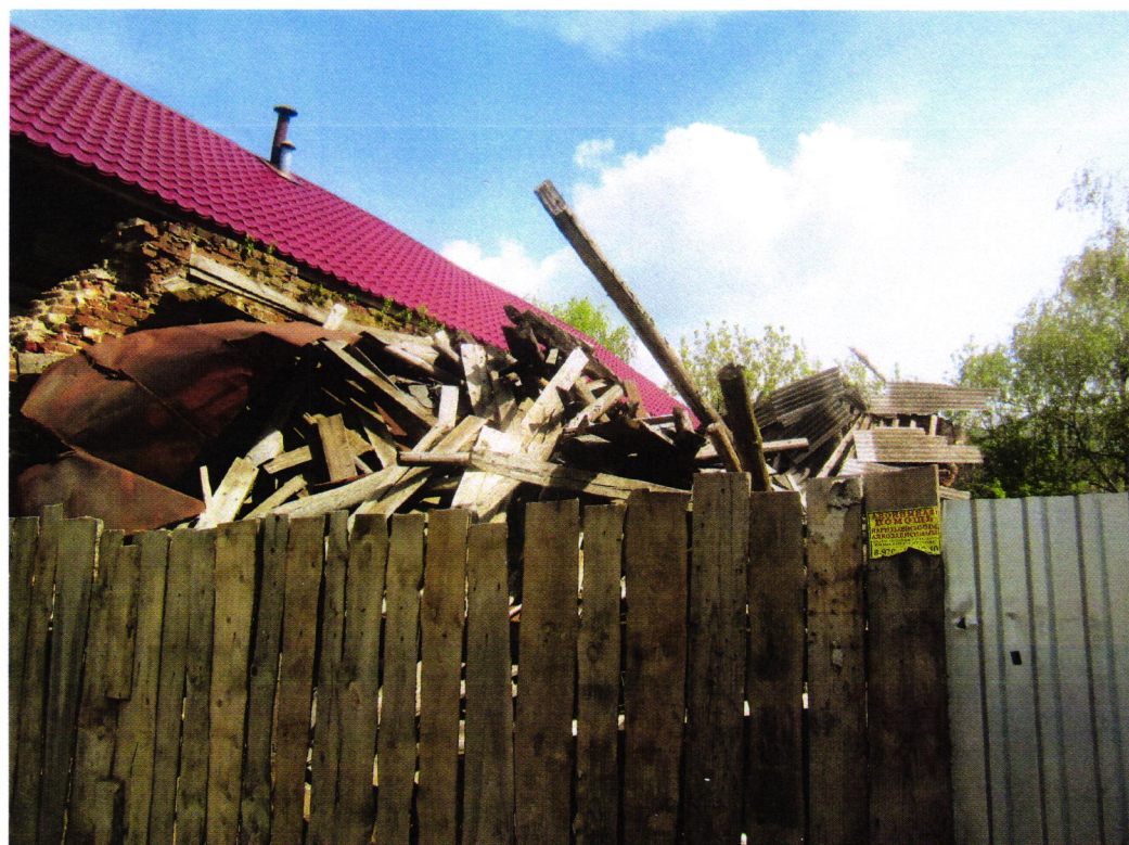
«Торговая палатка», 2-я пол. XIX в., по адресу: Костромская обл., г. Нерехта, ул.Ленина, 5а. Вид со стороны главного (западного) фасада.